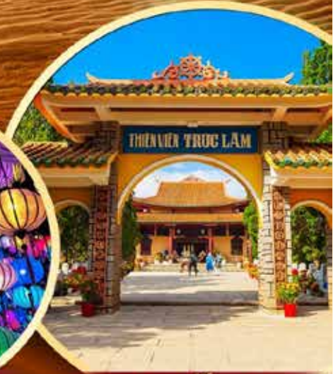
วัดตักสิม