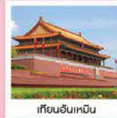
เทียนอันเหมิน

จัตุรัสเทียนอันเหมิน / พระราชวังโบราณกู้กง / หอประชุมเทียนถาน / POP LAND POP MART / ซุปเปอร์มาร์เก็ต / วัดลามะ / พิพิธภัณฑ์ภาพยนต์จีน พระราชวังฤดูร้อนอวิ๋เหอหยวน / กำแพงเมืองจีนด้านวิหิงกวน