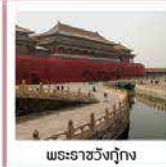
พระราชวังกู้กง