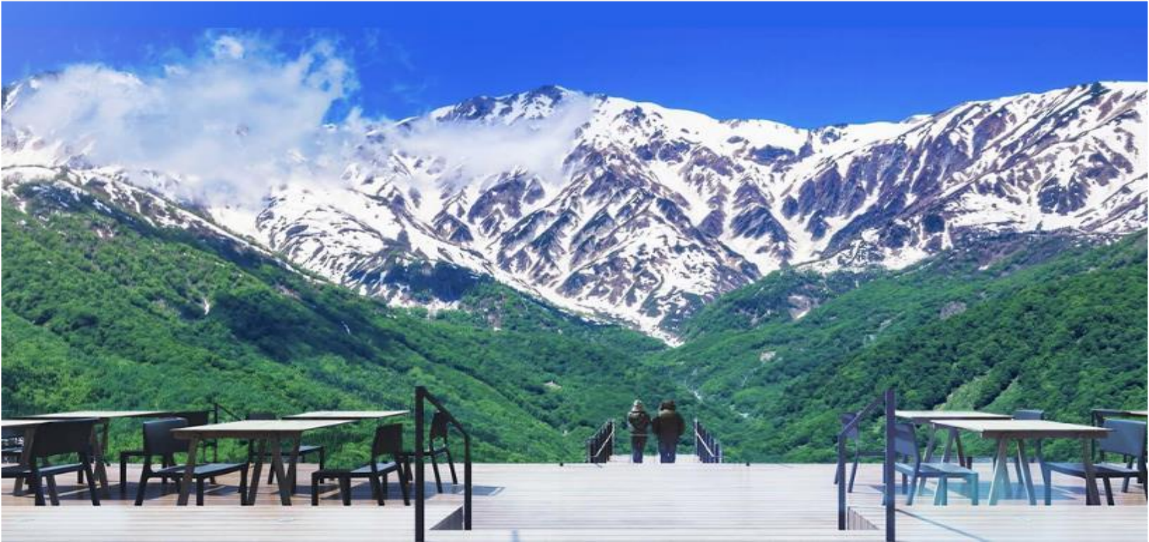
HAKUBA MOUNTAIN HARBOR

ไม่พลาดกับการชมวิวแบบพาโนรามา ณ Hakuba Mountain Harbor ด้วยทัศนียภาพที่เหนือชั้นของภูเขาโดยรอบ จุดเด่น คือ ระเบียง “Hakuba Sanzan” ที่สามารถเห็นเทือกเขาแอลป์แบบ 360 องศา ได้อย่างสวยงามในทุกฤดู สามารถยืนถ่ายรูป และดื่มด่ำกับบรรยากาศได้อย่างเต็มอิม ในบริเวณเดียวกันยังมีร้านเบเกอรี่ โดยทางเข้ามีที่นั่งบนระเบียง สามารถเพลิดเพลินไปกับการจิบเครื่องดื่มอุ่น ๆ พร้อมชมบรรยากาศตามอัธยาศัย