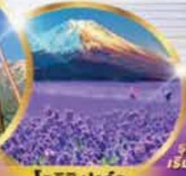
โออิชิ ปาร์ค