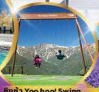
ชิงช้า Yoo hool Swing