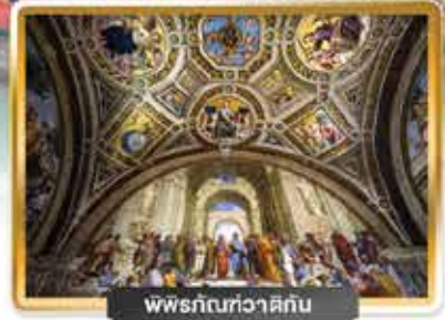
พิพิธภัณฑ์วาติกัน